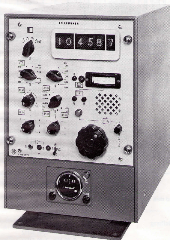
Empfänger mit Sondergehäuse

Zum Empfänger E 863 ist außer dem normalen Tischgehäuse ein Sondergehäuse für erhöhte Umgebungsbeanspruchung erhältlich. Das Sondergehäuse ist tropfwasserfest; es enthält eine Umwälzlüftung, Schockdämpfer und einen Betriebsstundenzähler.